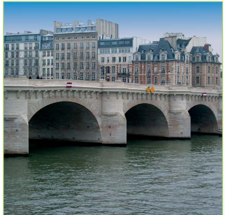
Le Pont Neuf (75)