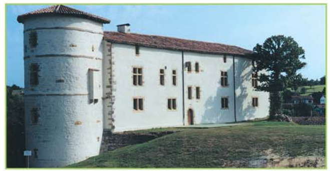
Château des Barons d'Espeleta (64) Espelette