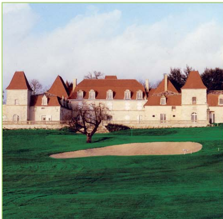
Château des Vigiers (24)